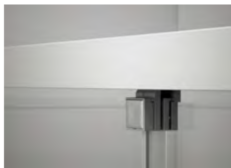
Juntas verticales de estanqueidad con nuevo diseño minimalista