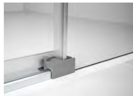
sin guía inferior