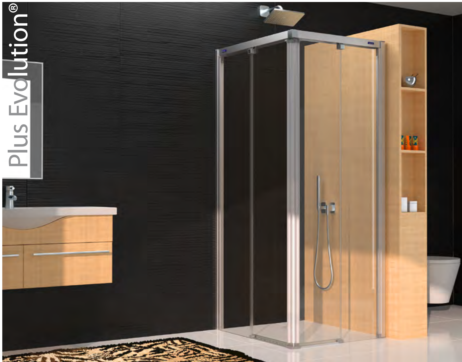
Ref. 7KF+ 7KG