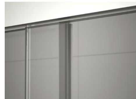
Juntas verticales de estanqueidad con nuevo diseño minimalista